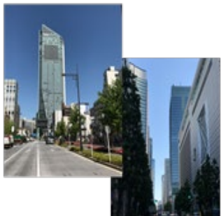
世界有数のビジネスエリア 「東京都港区」

本事業では、うつ病などの病気に至る前段階から、産業医を通じて疲労・ストレス外来を受診してもらい、 科学的根拠に基づいたメンタルヘルスケア領域における新たな医療を創成 することにより、患者の心の痛みを理解し患者の側に立つ全人的で高度な医療を提供するという建学の精神をブランド化する。