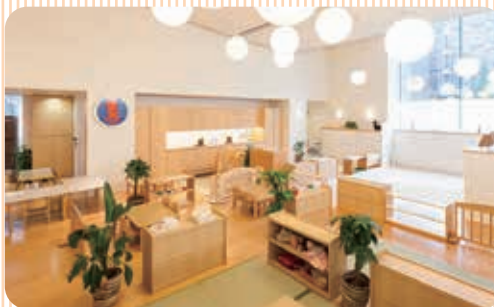
（株式会社資生堂が設置する事業所内保育施設）