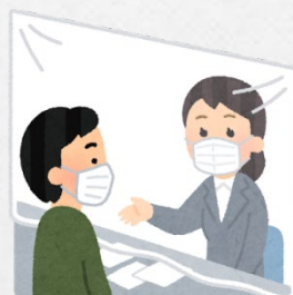
飛沫防止フィル ムの設置