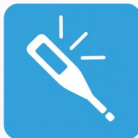
職員の健康管理 の実施