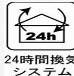
24時間換気 システム