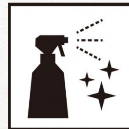
椅子や再来機等 の消毒