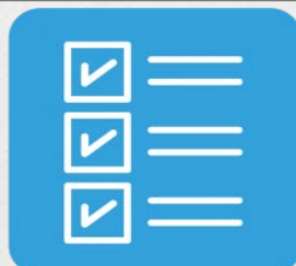
日帰り手術、入院前の2週間 健康チェックの実施