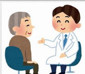
入院前感染検査の 実施（一部）