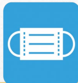
マスク着用の徹底