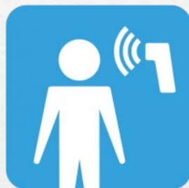
来院者の検温 チェック