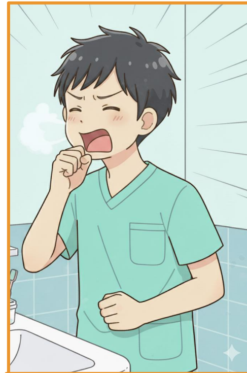
咳をして痰を出す