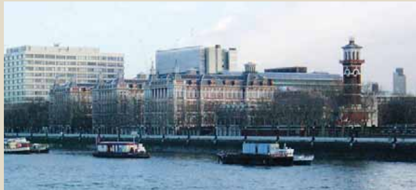
King's College London