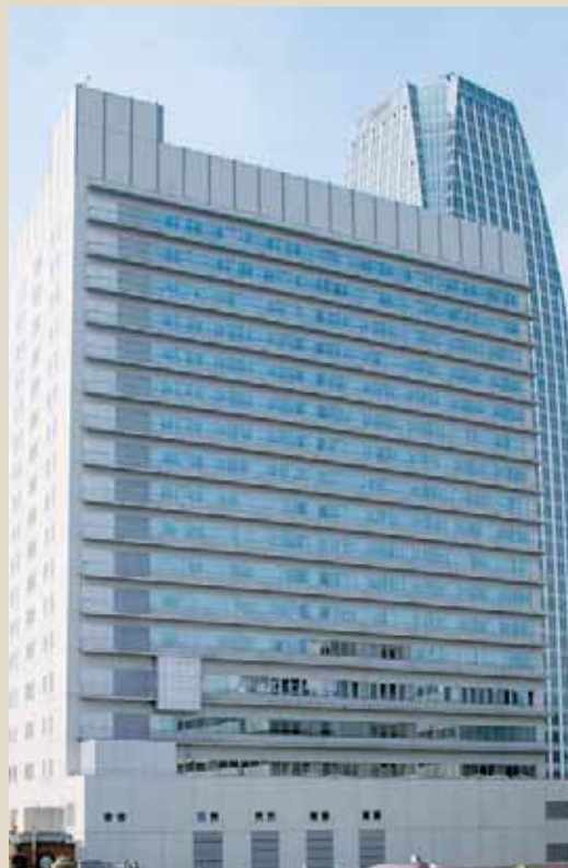
附属病院(本院)中央棟

また、国内外の医学雑誌や専門書を所蔵する学術情報センター図書館が高木会館にあります。