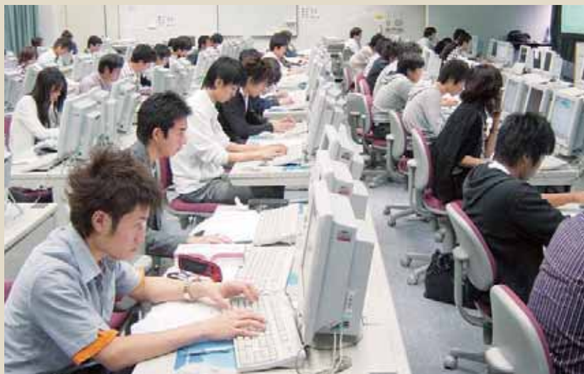
国領校コンピュータ演習室