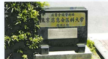
成医会講習所跡の 記念碑 東京都中央区銀座4-4-1

学祖と松山棟庵は18名の医師とともに、日本の貧弱な医療環境の改善を目指す学術団体「成医会」を発足(明治14年1月7日)させた。