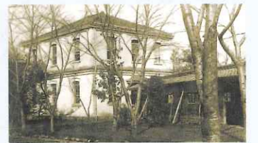
看護婦教育所建物(明治19年1月20日)

有志共立東京病院は、明治17年(1884)4月に病院総長としては有栖川威仁親王を戴き、正式に開院し、同年6月、翌年11月には、皇室・貴族などによる婦人慈善会が、2度にわたって鹿鳴館でバザーを行った。その収益金によって明治18年に日本初の看護婦教育所である「有志共立東京病院看護婦教育所」が設立された。この看護婦教育所が現在の慈恵看護専門学校の前身となっている。