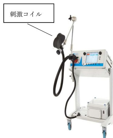
使用する磁気刺激装置