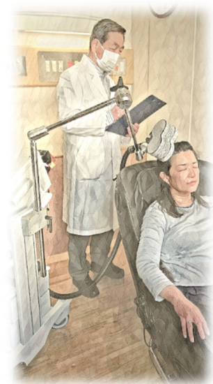
※画像はイメージです。 実際とは異なる場合があります。