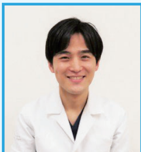
形成外科 診療部長