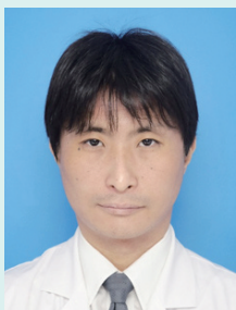
放射線部 診療部長