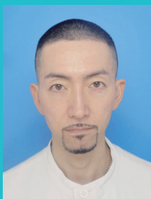
糖尿病代謝内分泌 内科 / 診療部長

当院皮膚科は、皮膚がんや難治性の乾癬/アトピーをはじめとした幅広い皮膚疾患に対応しております。「病気を診ずして病人を診よ」の理念のもと、患者さんの背景にも配慮した診療を提供しています。