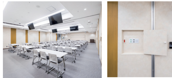
1階の「ガジュまるホール」。慈恵西部健康推進センターによる公開講座「慈恵ガジュまる教室」を定期的に開催し、ヘルスケア講演や相談、セミナーなどを行っています。

また、当院は東京都の災害拠点病院の指定を受けており、災害が起きた際には、ガジュまるホールが地域の緊急病棟の役割を担います。ホールの壁には酸素吸入や吸引が行える機能や非常電源などが設置され、治療を行うことが可能で、最大12床のベッドを入れることができます。最新鋭の設備を備えた強力なインフラとして、地域の皆さんの健康や安全・安心を提供できると確信しております。