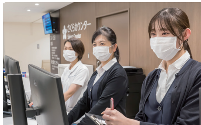
各診療科の受付には事務員のほか看護師も受付に立ち、患者さんの症状などを聞き取り、適切な診療科にご案内します。

そこで正しい鑑別・判断を行うためには、看護師という高いトリアージ技術を持った人員を前線に置くべきとの考えに至りました。前線に看護師が入る体制を採用している医療機関は、全国的にもまだ限られているのではないかと思います。