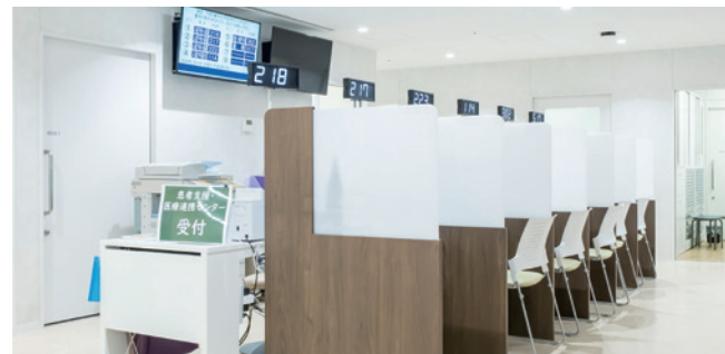
「患者支援・医療連携センター」の窓口には、看護師や医療ソーシャルワーカーが常駐し、入院や在宅医療の支援のほか、様々な相談に対応しています。

これらの新しい施設・設備を最大限に活用し、これまで以上に高度で質の高い医療を地域の方たちに提供できるよう、全力で取り組んでまいります。